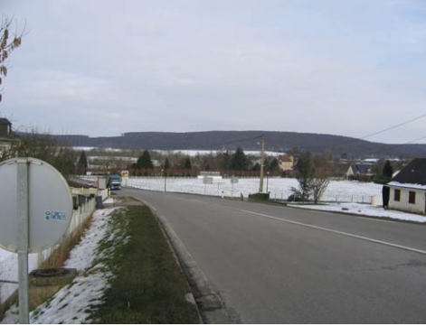
Vue depuis la RD