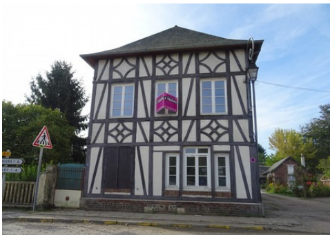
Des exemples de maisons à pans de bois

Les avis seront cohérents avec ceux émis ces dernières années, à savoir : pas de maisons à volume compliqué (type V, W, Y, ou Z), pentes à 45° pour les volumes principaux, ardoise ou tuile plate de teinte brun vieilli, à 20u/m², avec un débord de toiture de 20cm, enduit de teinte beige clair avec modénatures (au choix : chaînages, encadrement de fenêtres, soubassement, colombage...). *Voir les autres fiches.