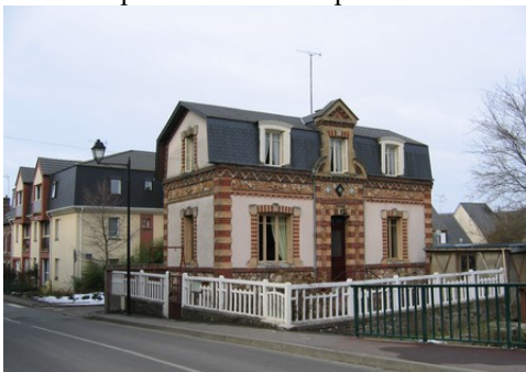
L'utilisation de briques en ornement