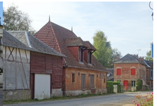
Le bâti rural avoisinant