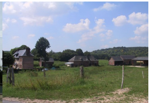
Une ancienne ferme